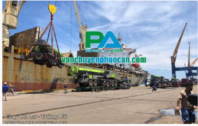
Cảng Chu Lai - Trường Hải 15°28'31.0"N 108°27'39.2"E