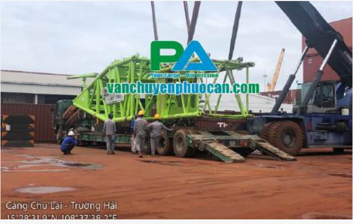
Cảng Chu Lai - Trường Hải 15°28'31.0"N 108°27'39.2"E