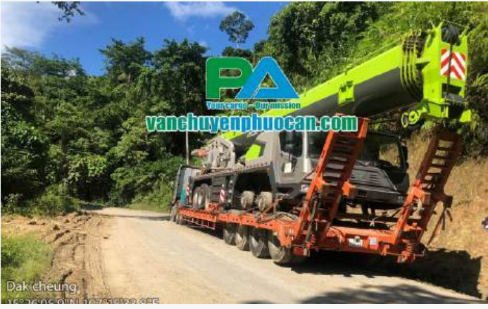
Dak cheung 17°52'42.0"N 102°50'39.0"E