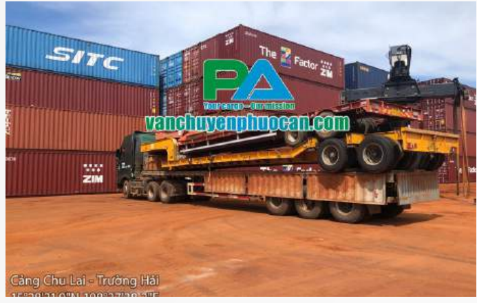
Cảng Chu Lai - Trường Hải 15°28'31.0"N 108°27'39.2"E